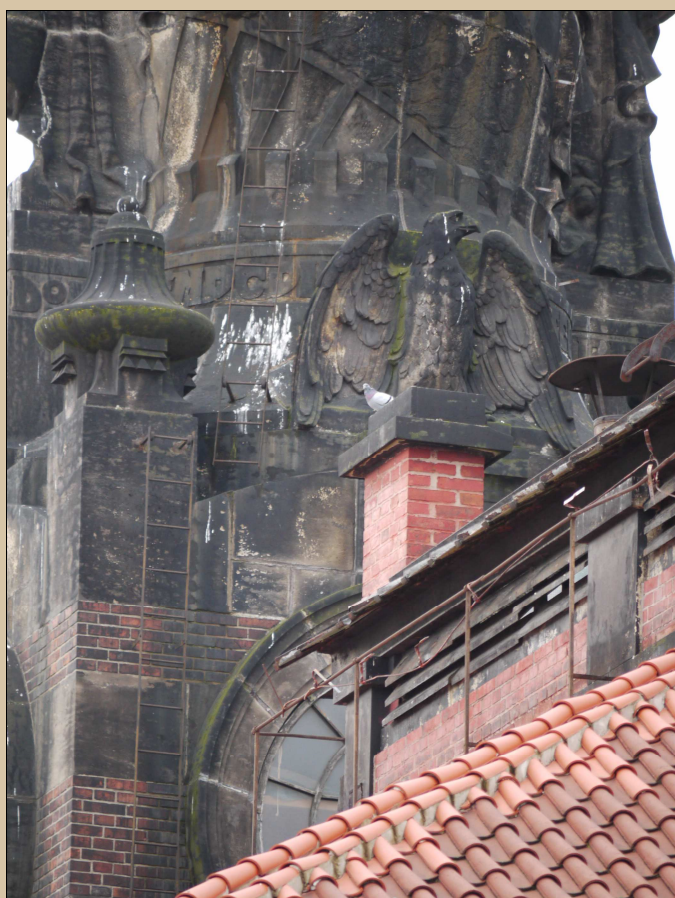
Stav v roce 2017