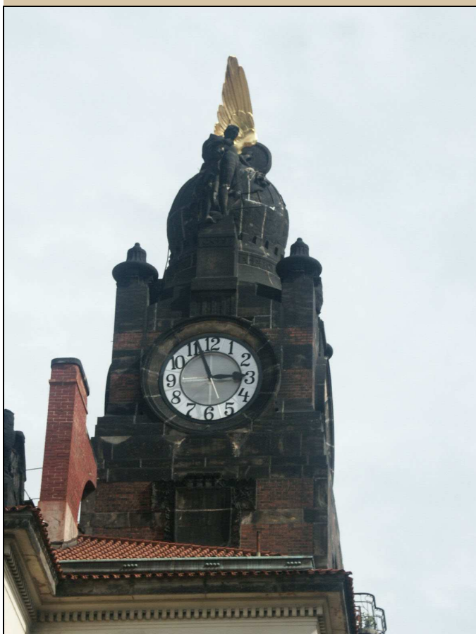
pohled na sousoší od západu