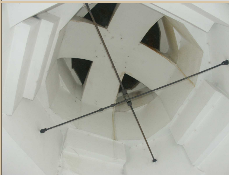
pohled do interiéru věže