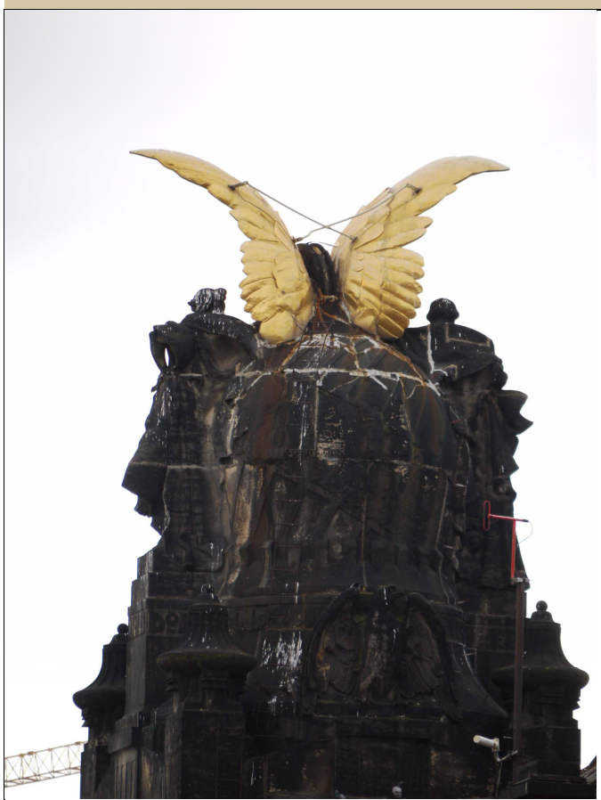
Stav v roce 2017