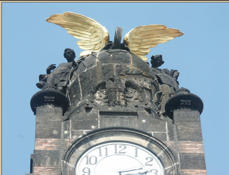
pohled na sousoší z jihu

Pískovec bude restaurovat restaurátor s licenci MK ČR. Provést omytí kamenného prvku, odstranění nesoudržných spár. Doplnění kamenné výzdoby umělým kamenem shodné struktury jako stávající kámen. Provést patinu shodně jako je provedena na části C v roce 2016. Podrobný popis návrhu je uveden v restaurátorském průzkumu a záměru. Viz technologický postup TP/107.